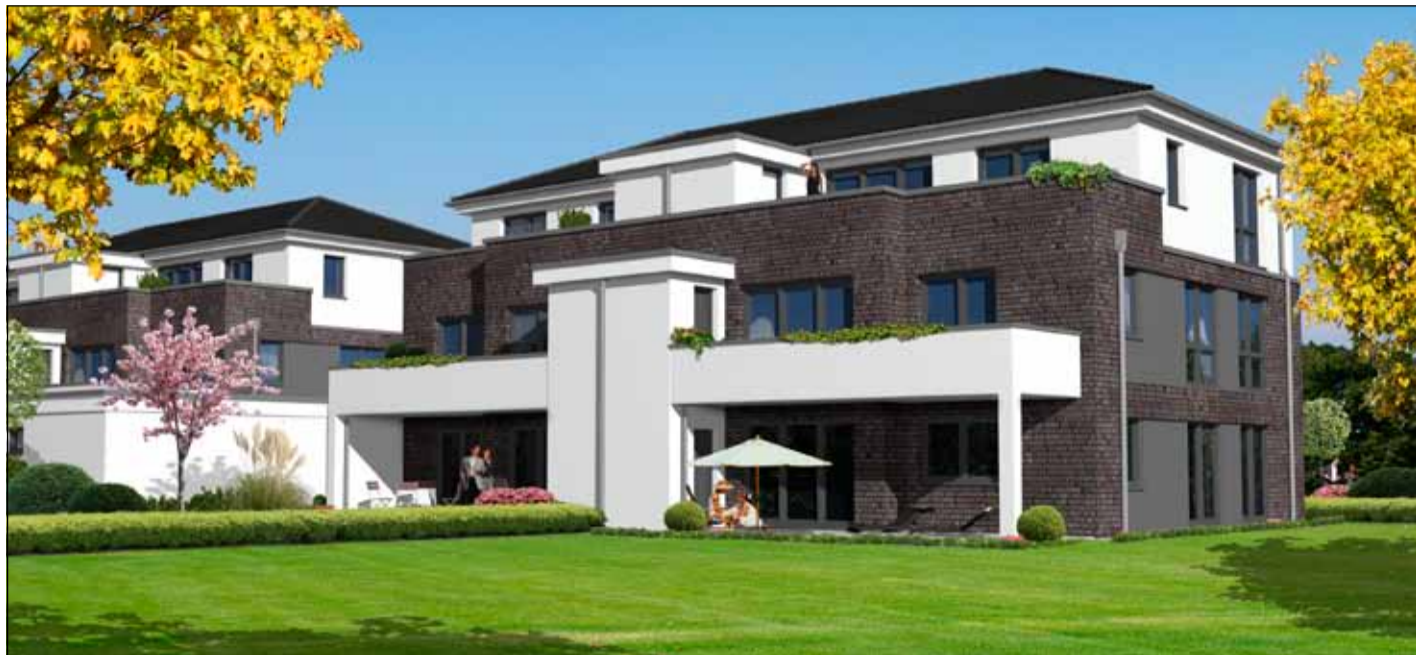
Im ADDO Village am Adendorfer Röthenweg leben die Bewohner vor den Toren Lüneburgs. Die Wohnungen werden den unterschiedlichsten Wünschen gerecht. Interessierte dürfen sich also auf ihren neuen Lebensmittelpunkt freuen.

Adendorf: Wohnen und Arbeiten vor den Toren Lüneburgs